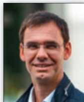
MAG. MARKUS WALLNER Landeshauptmann Amt der Vorarlberger Landesregierung