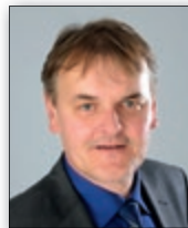
GEORG BUCHER Bürgermeister Gemeinde Bürs