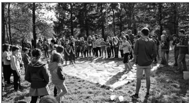
Galerie: Startfest 2015

Wer Interesse hat, aktiv mitzutun, der findet weitere Informationen unter www.pfadi-feldkirch.com .