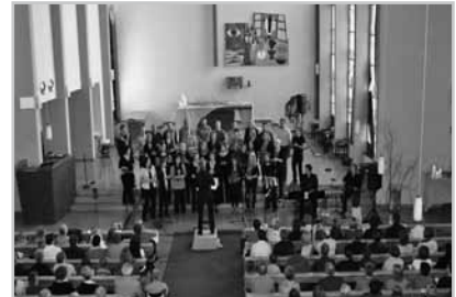
Beim Jubiläumskonzert des Nofler Chörle war die Kirche – zur Freude der Sängerinnen und Sänger - bis zum letzten Platz gefüllt.