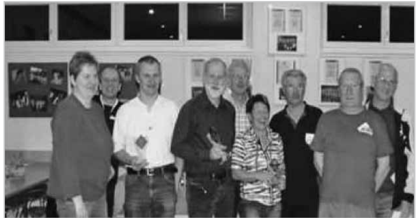
Siegerehrung nach der Finalrunde in Koblach

Dazu ein paar Fakten: 21. Oberländermeisterschaft 2010/11 Turnierdauer: Sept. 2010 bis März 2011 Mannschaften: 12 Spiele pro Mannschaft: 11 Austragungsorte: Nofels und Koblach Kegler pro Mannschaft: 5 Teilnehmer gesamt: 96 Kegler, davon 76 Herren und 20 Damen Wurf pro Kegler und Spiel: 100 (50 in die Vollen, 50 Abräumen) Wurf-Anzahl gesamt: 66.000 Erreichte Holzzahl gesamt: 258.377 Punkte-Wertung pro Spiel: max. 7, davon 2 für das Team mit der höheren Holzzahl, je 1 Punkt für die 5 besten Kegler (Holzzahl) Veranstalter: Kegelclub Nofels