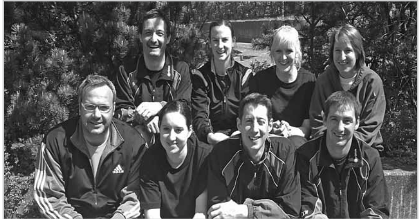
Mixed-Team beim Finalturnier

Herren Landesliga – 4. Endrang Herren Hobbyliga – 2. Endrang Mixed Hobbyliga – 10. Endrang