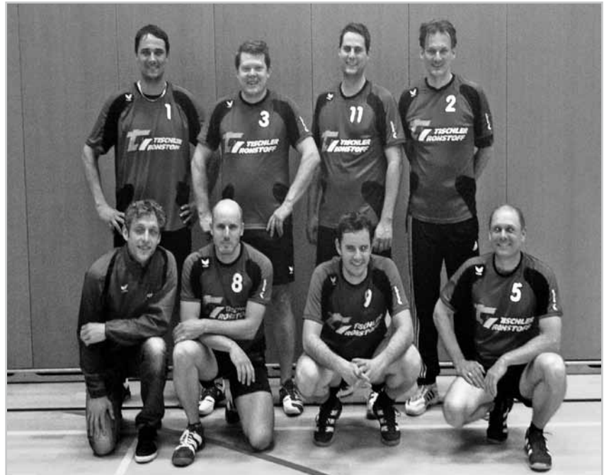
Herren-Team beim Spiel gegen Egg

Danach besannen sich die Spieler aus Nofels wieder ihrer Stärke sowie Routine und brachten das letzte Spiel dieser Saison locker nach Hause. Mit diesem Sieg verpassten die Nofler knapp das Podest und landeten in der Hallensaison 2010/11 auf dem vierten Platz in der Vorarlberger Landesliga.