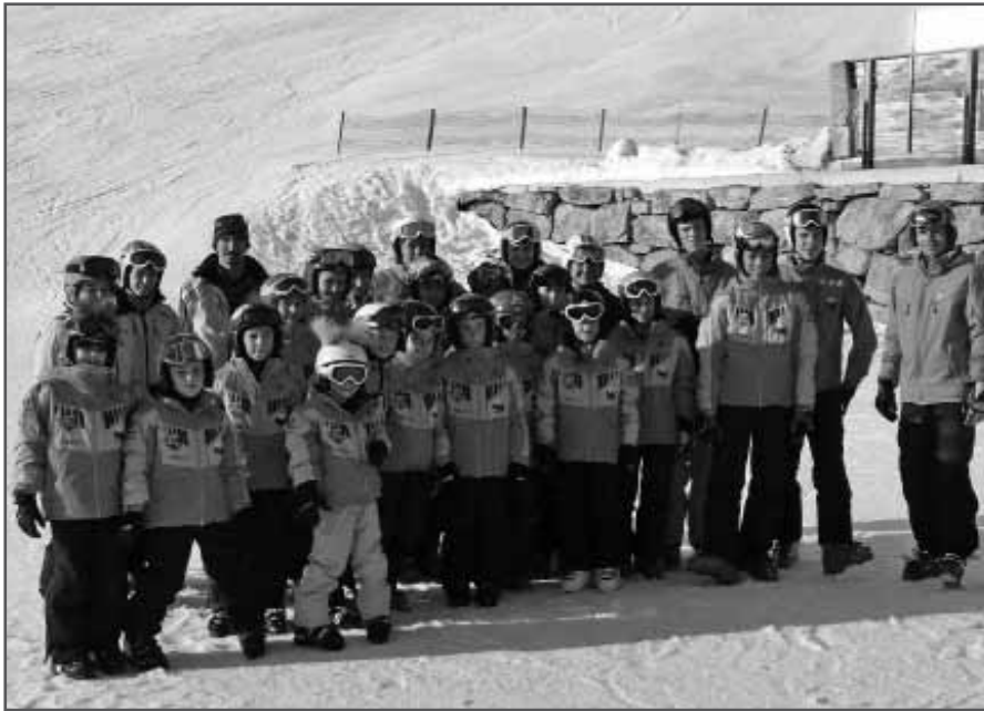
Die jüngsten Kader-Kids mit Marlies Schild Gruppenfoto

Auch in diesem Jahr fuhr der WSV Nofels mit den Kader-Kids zum Training nach Sölden. Trainer und Eltern haben sich beim Weltcup-Start bei Traumwetter auf den kommenden Winter eingestimmt und carvten in der neuen Rossignol-Schibekleidung über die tollen Pisten. Das Programm war gestaltet mit Training und Besuch der Weltcuprennen. Viele Schistars konnten auf der anspruchsvollen Piste und auch danach im Zielgelände hautnah bewundert werden.