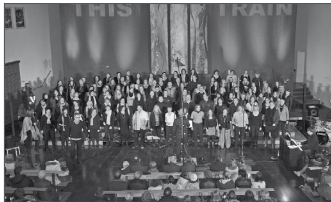
Mehr als 100 Sängerinnen und Sänger begeisterten das Publikum in Tisis und Altach.

Das Nofler Chörle bedankt sich bei den „Gastsängerinnen und -sängern“ für das große Interesse, die schöne gemeinsame Zeit und die angenehmen Proben. Ein großes Dankeschön gilt auch der Jungen Kirche Vorarlberg, dem Pfarrverband Tisis-Tosters-Nofels sowie der Pfarre Altach für die Kooperation und Zusammenarbeit. Durch die große Spendenfreudigkeit, konnte ein Reinerlös von 3.270 Euro an ein Hilfsprojekt auf den Philippinen überwiesen werden.