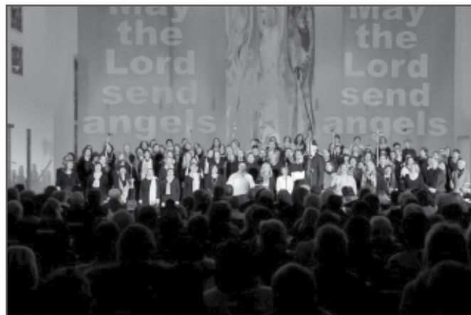
Vorwiegend mit musikalischen Klängen, aber auch mit außergewöhnlichen Lichteffekten wurde eine besondere Atmosphäre geschaffen.