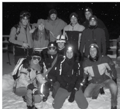
Trotz eisiger Kälte bei bester Laune: die Teilnehmer des Weihnachtsausfluges 2009

Nach einer rasanten Rodelpartie fand der Weihnachtsausflug in den warmen Lokalen seinen Ausklang.