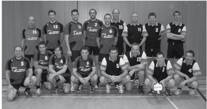
Links die Herren der Landesligamannschaft, rechts das Hobbyteam vor dem vereinsinternen Derby am 7.1.2010

Doch wer dachte, die Landesliga-Mannschaft ergebe sich kampflos, täuschte sich. Beim Spielstand von 8:7 ging es in die erste Auszeit. Leider riss der Faden bei der 1. Mannschaft und die Hobbys spielten den Satz sicher mit 25:19 nach Hause. Die Überraschung war perfekt, das Endergebnis lautete 3:0 (25:20, 26:24, 25:19) für das Hobbyteam! Anschließend feierte die Heim- mit der Gastmannschaft in aller Freundschaft und auch die Schiedsrichter sowie die Zuschauer, die natürlich hin- und hergerissen waren, stießen ebenfalls miteinander an.